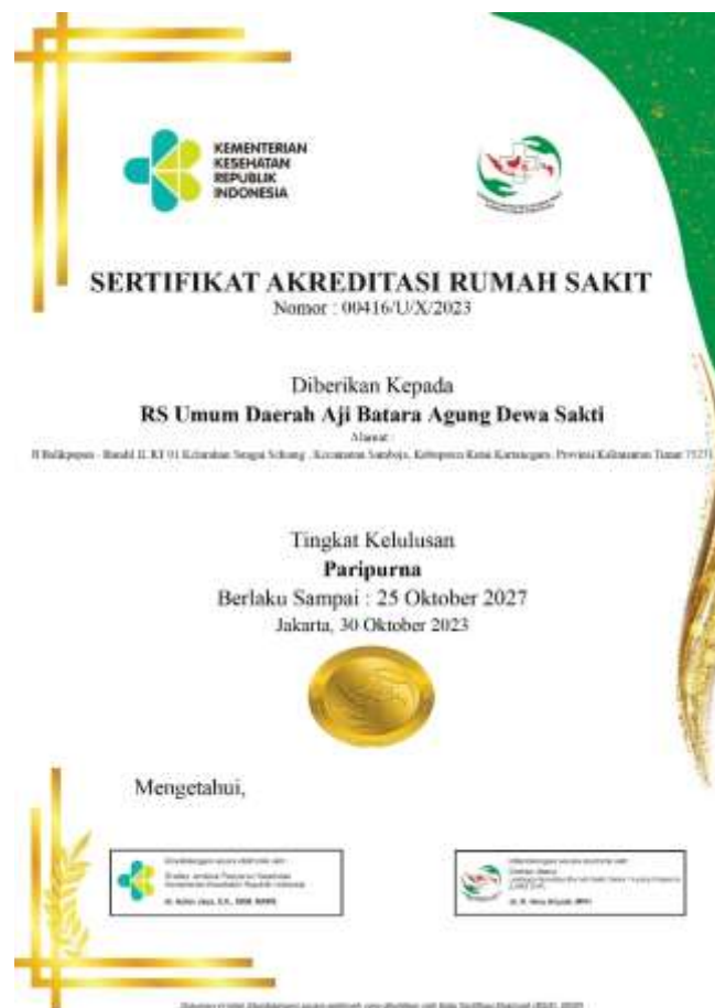
Gambar 1. Sertifikat Akreditasi RSUD Aji Batara Agung Dewa Sakti

Berdasarkan Survey Akreditasi Rumah Sakit pada RSUD Aji Batara Agung Dewa Sakti yang dilaksanakan pada tanggal 12 Oktober 2023 dan 13 Oktober 2023 oleh Lembaga Akreditasi Rumah Sakit Damar Husada Paripurna (LARS DHP), RSUD Aji Batara Agung Dewa Sakti memperoleh Tingkat Kelulusan Paripurna , yang tercantum pada Sertifikat Akreditasi Rumah Sakit Nomor 00416/U/X/2023 yang berlaku sejak tanggal 30 Oktober 2023 sampai dengan 25 Oktober 2027.