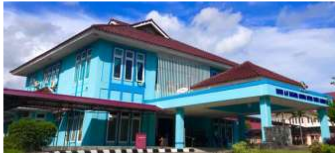
Gambar 2. Gedung Manajemen