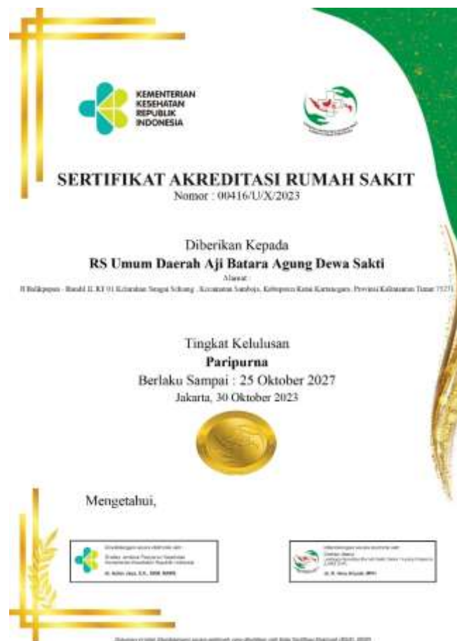
Gambar 1. Sertifikat Akreditasi RSUD Aji Batara Agung Dewa Sakti

Berdasarkan Survey Akreditasi Rumah Sakit pada RSUD Aji Batara Agung Dewa Sakti yang dilaksanakan pada tanggal 12 Oktober 2023 dan 13 Oktober 2023 oleh Lembaga Akreditasi Rumah Sakit Damar Husada Paripurna (LARS DHP), RSUD Aji Batara Agung Dewa Sakti memperoleh Tingkat Kelulusan Paripurna , yang tercantum pada Sertifikat Akreditasi Rumah Sakit Nomor 00416/U/X/2023 yang berlaku sejak tanggal 30 Oktober 2023 sampai dengan 25 Oktober 2027.