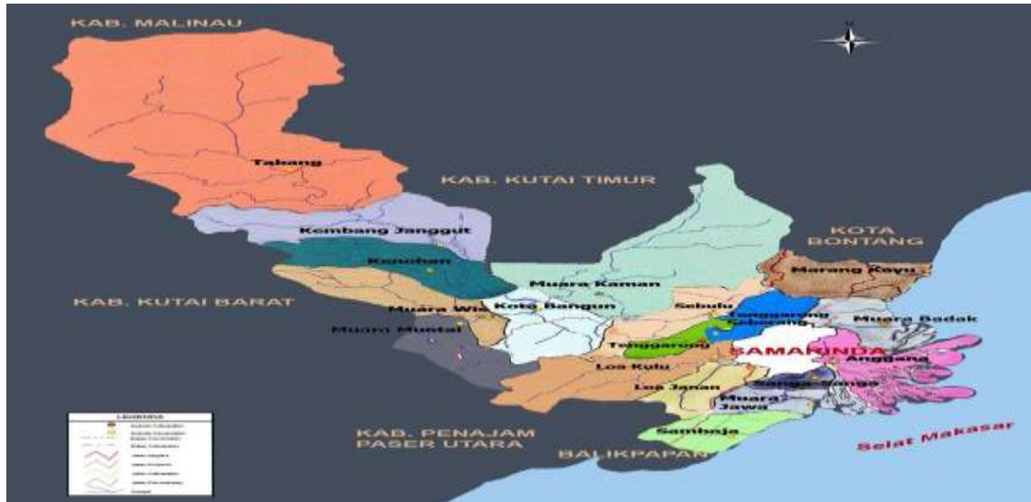
Tabel 1.2 Peta Wilayah Adminsitratif Kecamatan Kenohan

Dengan luas wilayah Desa di Kecamatan Kenohan Sebagai Berikut :