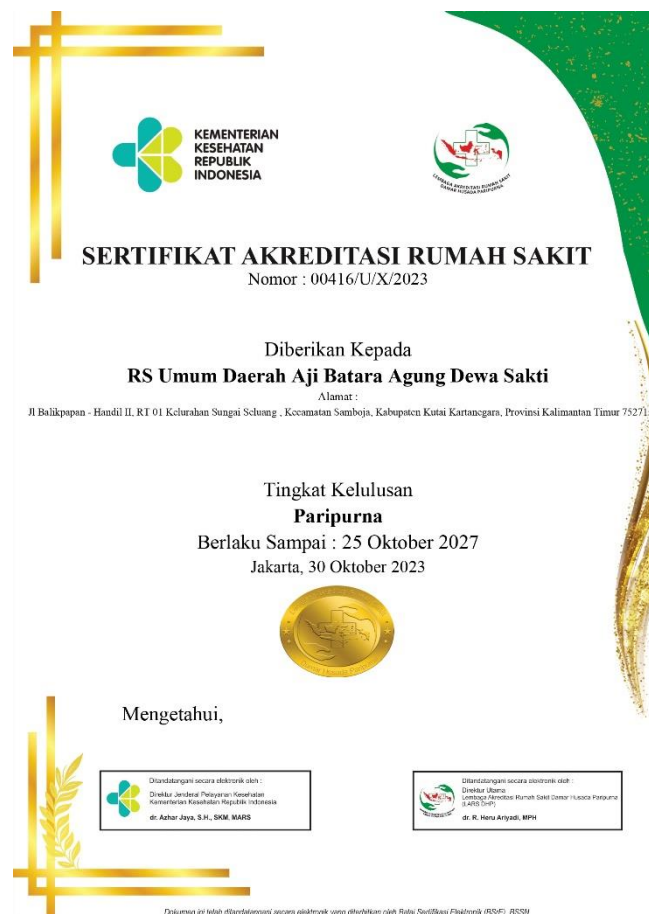
Gambar 1. Sertifikat Akreditasi RSUD Aji Batara Agung Dewa Sakti

Berdasarkan Survey Akreditasi Rumah Sakit pada RSUD Aji Batara Agung Dewa Sakti yang dilaksanakan pada tanggal 12 Oktober 2023 dan 13 Oktober 2023 oleh Lembaga Akreditasi Rumah Sakit Damar Husada Paripurna (LARS DHP), RSUD Aji Batara Agung Dewa Sakti memperoleh Tingkat Kelulusan Paripurna , yang tercantum pada Sertifikat Akreditasi Rumah Sakit Nomor 00416/U/X/2023 yang berlaku sejak tanggal 30 Oktober 2023 sampai dengan 25 Oktober 2027.