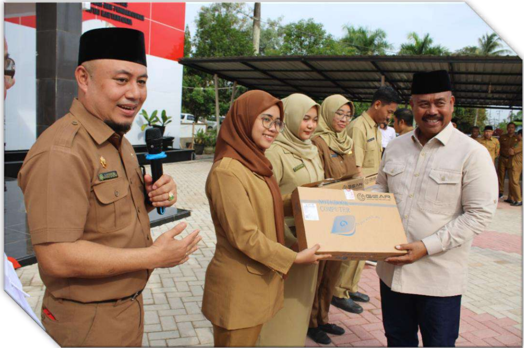
Gambar.3.5. Penyerahan Sarana Kerja Secara Simbolis Oleh Bupati Kepada Perwakilan ASN Inspektorat