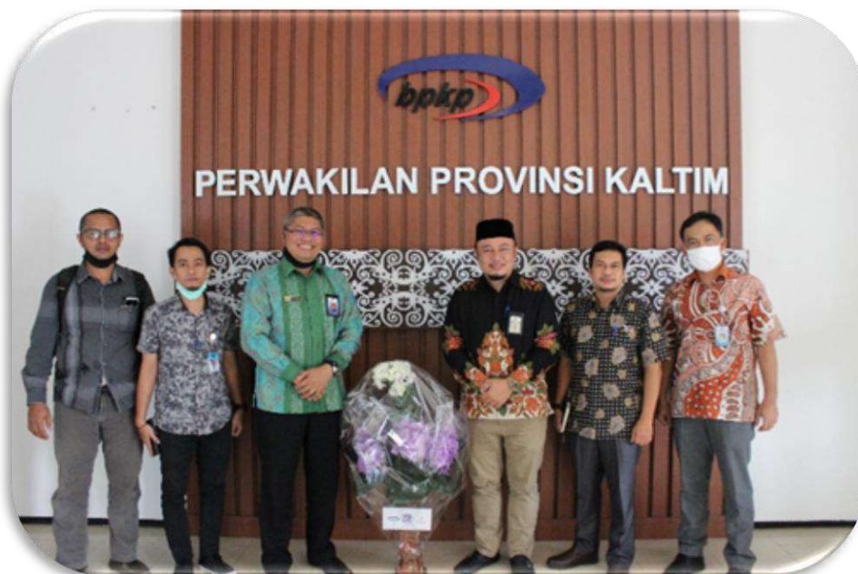
Gambar.3.3. Kunjungan Kerja ke BPKP Perwakilan Provinsi Kaltim