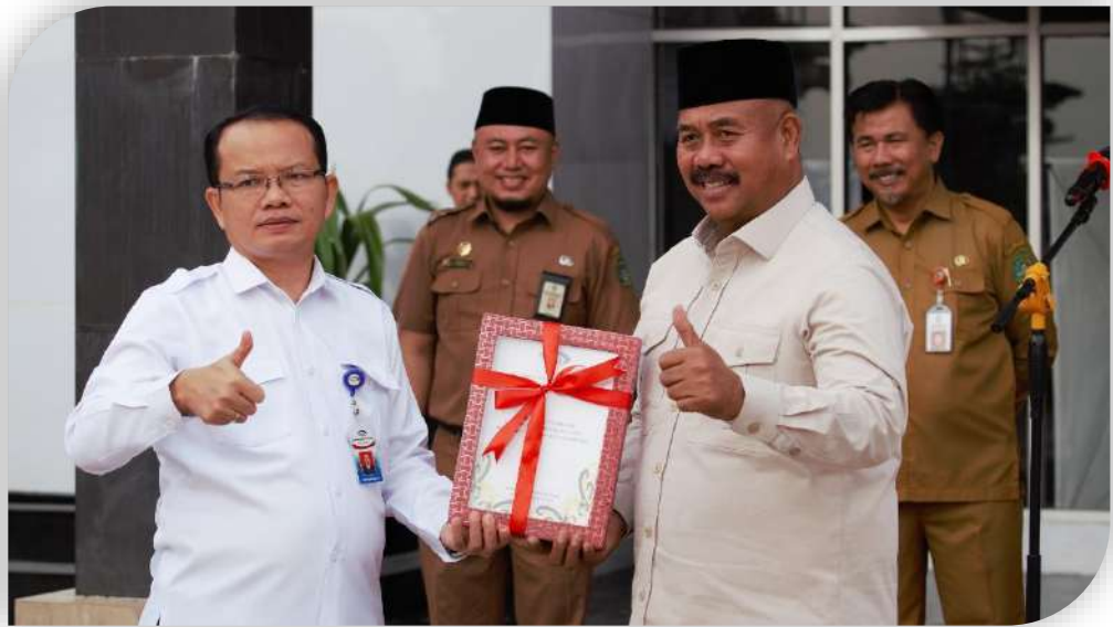
Gambar.3.4.Penyerahan Hasil Penilaian Maturitas SPIP dan Kapabilitas APIP Level 3 Oleh Kepala BPKP Provinsi Kalimantan Timur

Penilaian Maturitas Sistem Pengendalian Intern Pemerintah (SPIP) sudah mencapai target yang telah ditetapkan, yakni dari 3 Nilai yang ditargetkan dengan capaian 3 Nilai.