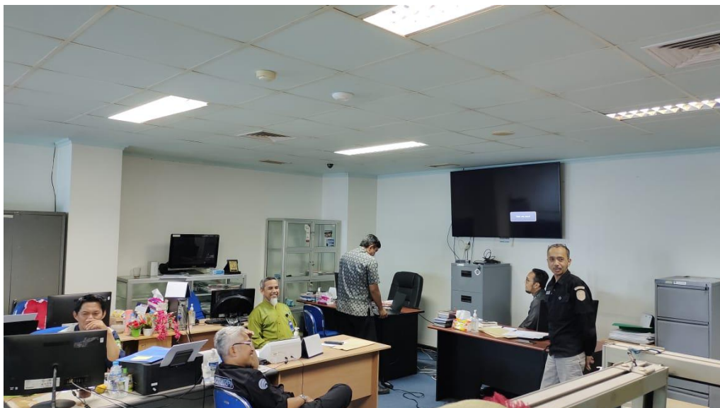
TIM PENGELOLA INFORMASI PUBLIK PPID DISKOMINFO