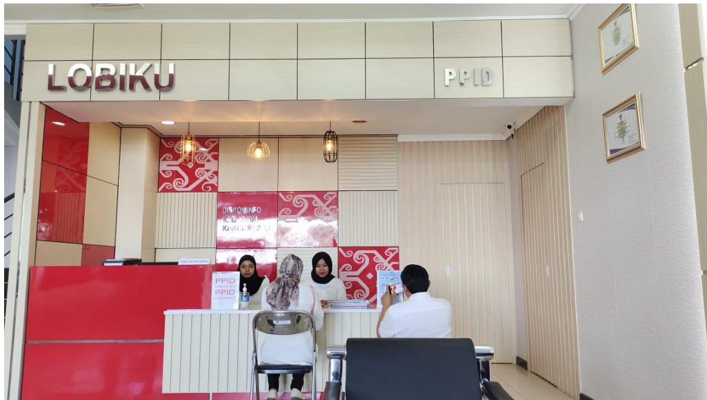
DESK LAYANAN PPID PELAKSANA DISKOMINFO